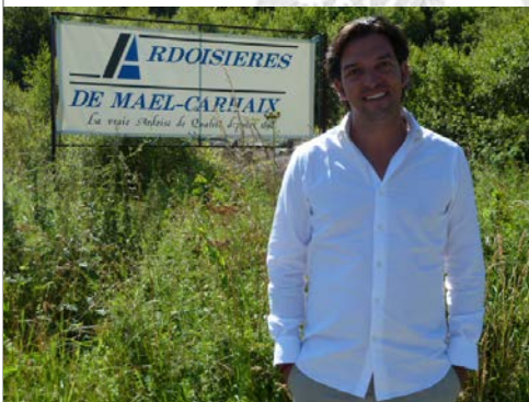
be natural® visita la cantera de Mael Carhaix (Bretaña)